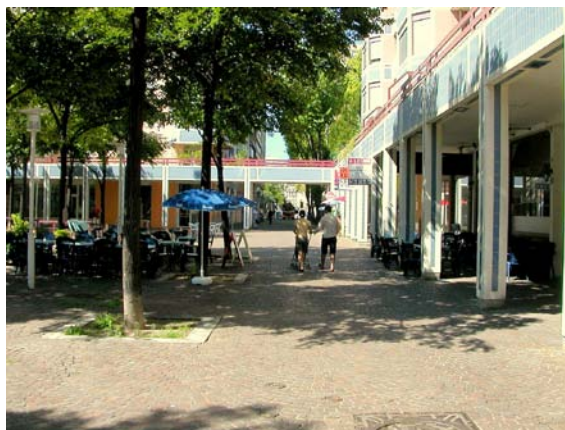
Organisation des occupations de l'espace public pour dégager un cheminement piéton

Par ailleurs, il peut être tentant de profiter de l'espace public dégagé de la circulation motorisée pour multiplier les autorisations d'occupation de cet espace notamment pour les commerces (terrasses de café, étalages, panneaux publicitaires, ...). Ces occupations font l'objet d'une autorisation auprès de l'autorité compétente et celle-ci devra veiller à délimiter clairement ce qui est compatible avec le cheminement libre de tout obstacle et s'assurer un contrôle régulier de l'occupation de l'espace public. En effet, dans tous les cas, on veillera à ne pas mettre d'obstacle au déplacement des piétons sur le cheminement privilégié (cf. personnes à mobilité réduite).