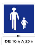
aire piétonne temporaire quotidienne