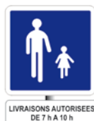
aire piétonne permanente avec règle d'accès