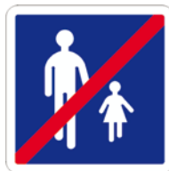
B55 Fin d'aire piétonne

La fin de l'aire piétonne peut être annoncée par un des panneaux suivants :