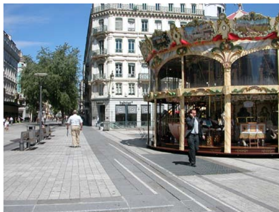
Organisation d'espaces dédiés au repos ou au jeu au sein d'une aire piétonne

Par ailleurs, il est possible de prévoir à l'intérieur des aires piétonnes des espaces dédiés à la pratique de certaines activités telles que des aires de jeu (que ce soit pour enfant ou pour adulte, par exemple des tables pour les jeux de société...). Il est conseillé d'aménager des espaces de repos pour tenir compte du vieillissement de la population et de la nécessité pour certains piétons de trouver des lieux où faire étape, même pour des déplacements de quelques centaines de mètres.