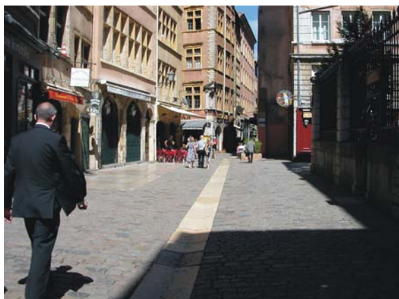
Rue piétonne quartier ancien