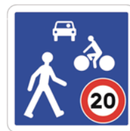
B52 Entrée d'une zone de rencontre