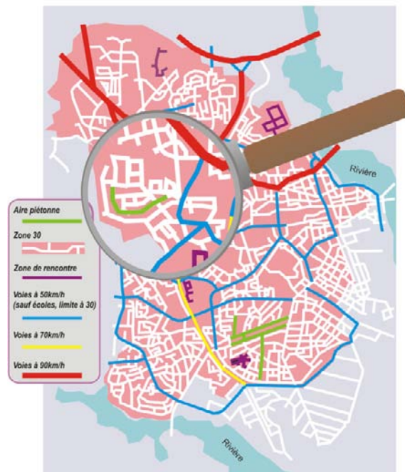
Plan théorique d'un réseau de voirie hiérarchisé

Elle est adaptée aux lieux qui présentent une forte densité de piétons (hyper-centre, lieux culturels, commerciaux, etc.), pour lesquels on souhaite créer un espace où l'on privilégiera l'absence de véhicules motorisés pour mener des activités qui cohabitent difficilement avec ceux-ci.