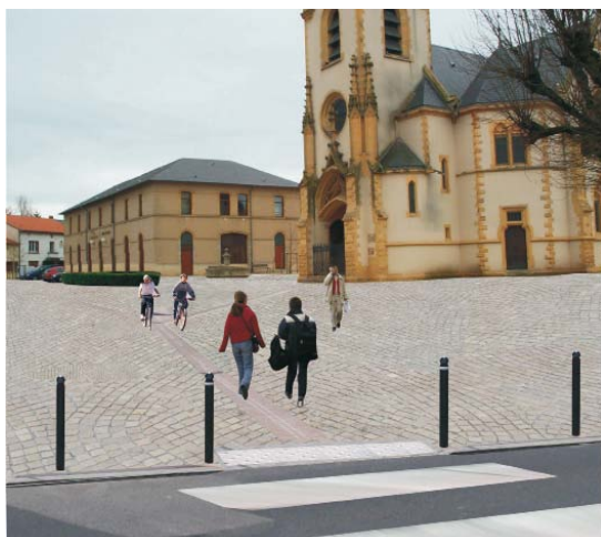
Grand parvis - photo CERTU/LREP