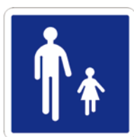
Panneau B54 Entrée d'une aire piétonne

Le choix d'un panneau montrant explicitement deux piétons, un adulte et une fillette, vise à exprimer la priorité du piéton et le fait que l'espace lui est réservé.