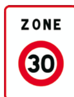
B30 Entrée d'une zone 30