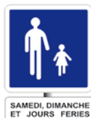
aire piétonne temporaire hebdomadaire (liée au loisir et au tourisme)

C'est un panneau zonal, c'est-à-dire que ses prescriptions s'appliquent à l'ensemble de la zone signalée (axe sur lequel il est implanté et ensemble des voies sécantes) jusqu'à ce que l'utilisateur franchisse un panneau modifiant cette prescription (B55, B52, B30, EB20), même si l'utilisateur change plusieurs fois de direction.