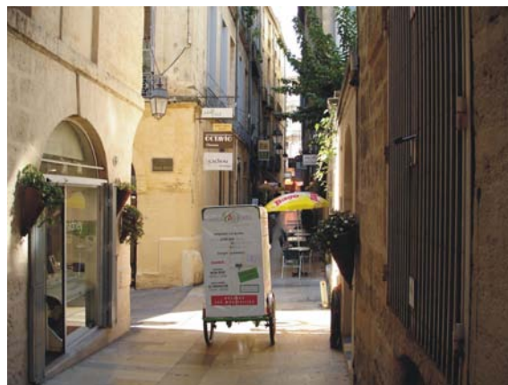
Livraison terminale en tricycle

Par ailleurs dans tous les cas, le passage de certains véhicules doit être maintenu ou une organisation adaptée doit être mise en place (notamment pour le ramassage des ordures ménagères