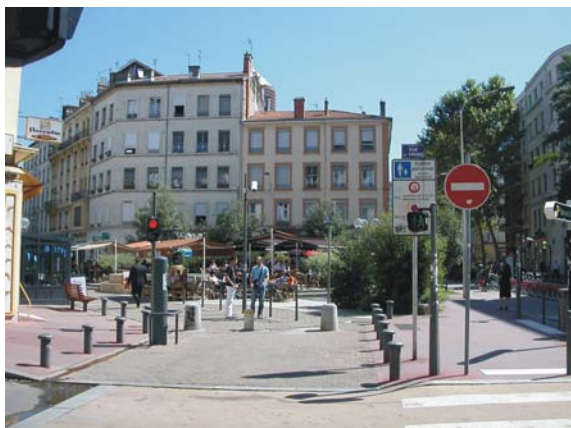
Régulation d'entrée d'aire piétonne

Pour la signalisation, comme il est de règle en milieu urbain, le recours au marquage au sol et à la signalisation de type routier est à éviter.