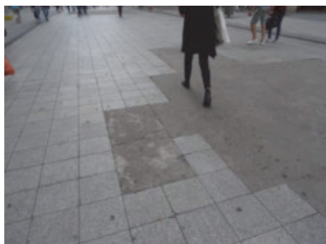
Rue de la République : pourquoi après chaque exécution de travaux ne replace-t-on pas des revêtements de pierre ?

Il est pourtant possible de remédier à ces insuffisances.