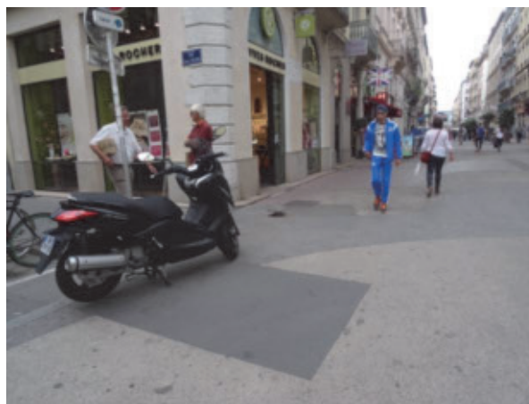
Rue Victor Hugo : le réaménagement est sans cesse reporté