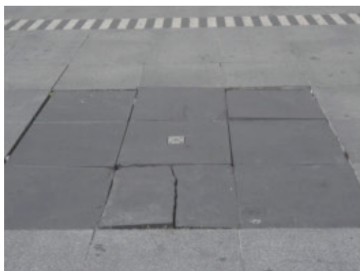
Place des Terreaux, les 69 petites fontaines toujours sèches et dégradées

Dans la Presqu'île, pourtant classée au Patrimoine mondial de l'UNESCO, l'état de dégradation de certains espaces publics majeurs nous choque :