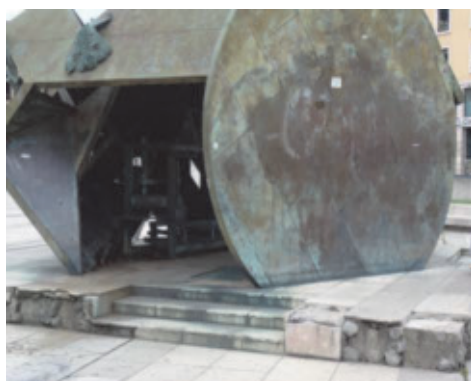
Place Louis Pradel : que penserait Ipousteguy du soin apporté à ses œuvres ?