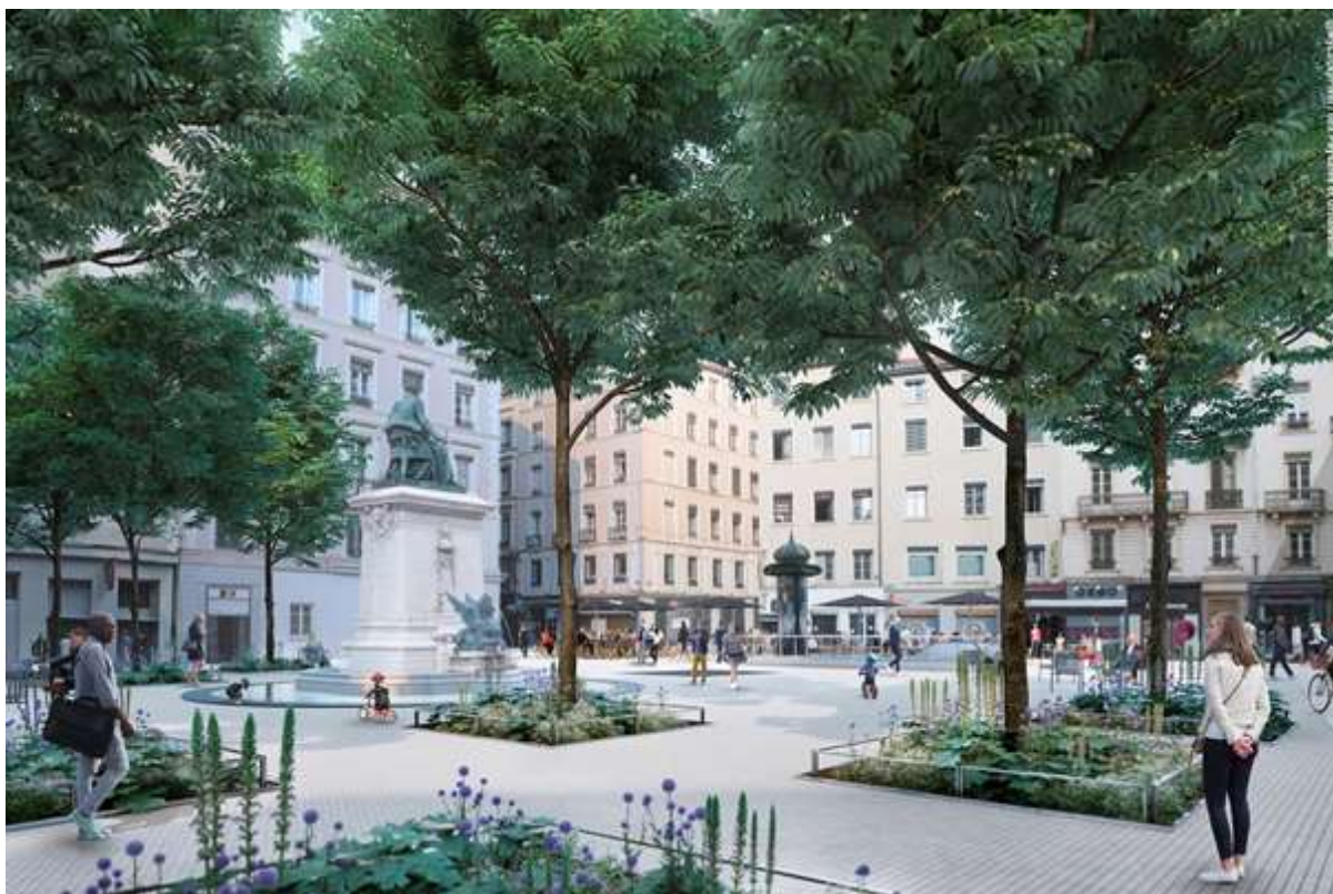
Aménagement de la Place Ampère

De profonds changements sont en cours sur notre territoire : piétonisation et circulation en « modes doux », « végétalisation », réfection des rues et places, dont les chantiers suscitent de nombreux et souvent légitimes commentaires.