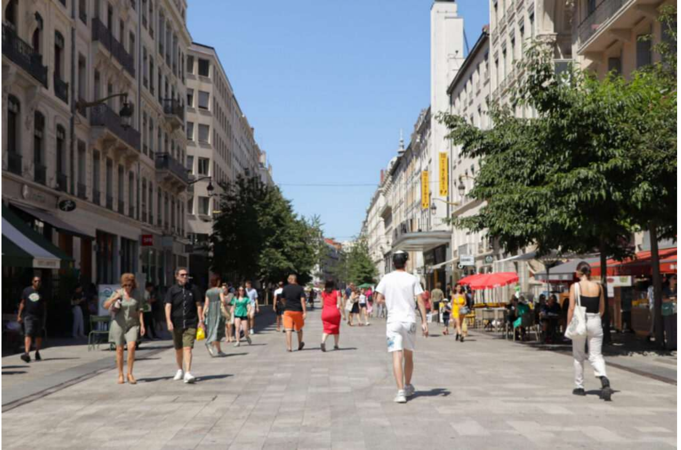
Rue de la République