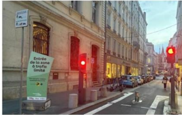
L'une des entrées de la Zone à trafic limitée (ZTL), située rue Gentil.

Julien vit à l'extérieur de la Zone à trafic limitée (ZTL), en bas des pentes de la Croix-Rousse, et possède un abonnement au parking souterrain de la place des Terreaux. Considéré comme limitrophe de la ZTL, il est obligé de faire un détour de 15 à 20 minutes par les quais de Saône pour se rendre au travail. L'habitant, mécontent, demande un badge afin de pouvoir circuler dans la ZTL.