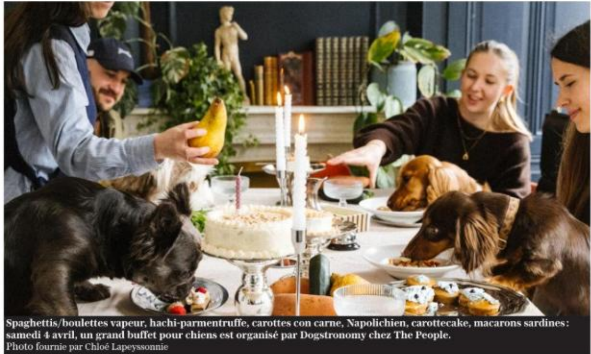
Spaghettis/boulettes vapeur, hachi-parmentruffe, carottes con carne, Napolichien, carottecake, macarons sardines: samedi 4 avril, un grand buffet pour chiens est organisé par Dogstronomy chez The People.

nourrir son chien, de lui apporter les nutriments nécessaires à son bon développement, la jeune femme s'est donc formée à la confection de nourriture animale. Après tout, «j'adore cuisiner et manger de bons petits plats, il n'y avait pas de raisons pour que Loki ne découvre pas lui aussi de nouvelles odeurs, de nouvelles saveurs. Surtout, diversifier son alimentation permet de développer son microbiote et de le préparer aux changements liés à son vieillissement, lorsqu'ils arriveront», poursuit la jeune cheffe d'entreprise qui «élabore quotidiennement, pour ses clients, des rations ménagères avec des produits de saison et de qualité».