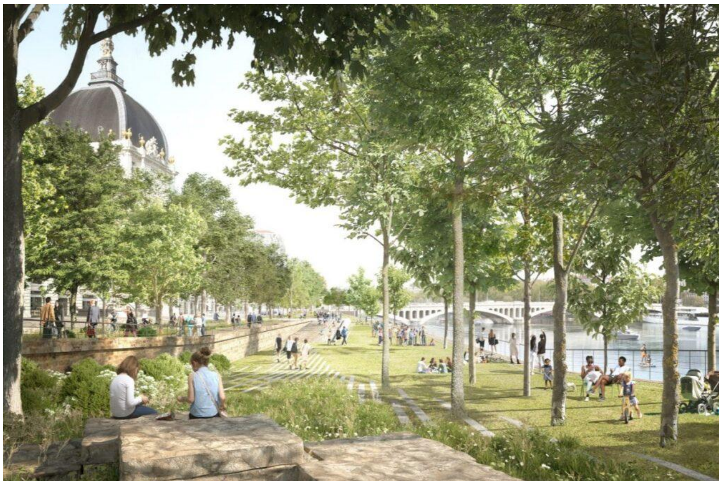
Le projet de réaménagement de la rive droite du Rhône au niveau de l'Hôtel Dieu.

La Métropole nouvellement présidée par Véronique Sarselli confirme l'arrêt des premiers travaux de l'ambitieux projet Rive Droite lancés par l'exécutif de Bruno Bernard.