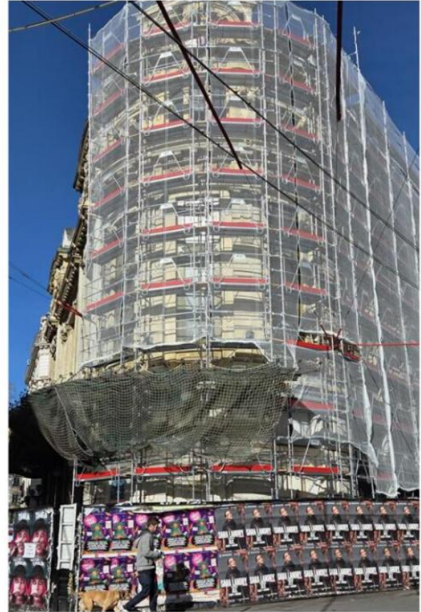
Des échafaudages ont été installés sur les façades de la salle Rameau. Cela permettra le ravalement de l'immeuble dont l'achèvement est prévu d'ici la fin de l'année.