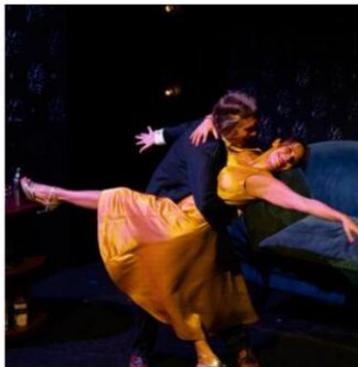
En attendant Bojangles, à la Comédie Odéon.