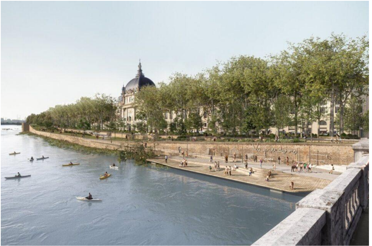
La future terrasse de l'Hôtel Dieu sur la rive droite du Rhône à Lyon.

« En conséquence, il a été décidé de suspendre le démarrage des travaux le temps de permettre cette concertation », écrit la Métropole de Lyon, qui rappelle que le chantier, s'il est poursuivi, aura « de lourdes conséquences sur la circulation pendant plusieurs semaines, impactant significativement le quotidien des habitants. »