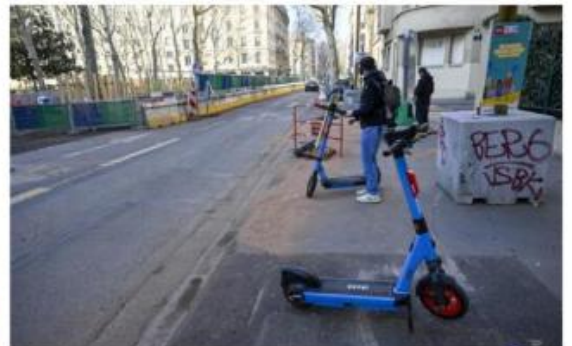
Deux hommes de 19 et 22 ans ont été tués en trottinette par un automobiliste en février 2025.

Si Dott poursuit ses efforts en matière de sécurité, c'est qu'elle devient l'enjeu principal des appels d'offres lancés par les collectivités. Et ce pour de bonnes raisons. À Lyon, plusieurs utilisateurs de trottinettes électriques ont perdu la vie ces dernières années.