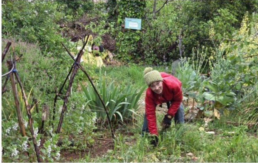
L'association Les Jardins suspendus fait vivre les toits de Perrache depuis 15 ans. Ils comptent une vingtaine d'adhésions, soit environ 40 personnes.

Ils ont lancé un appel à projets en 2019 pour que la terrasse située dans les hauteurs du centre d'échanges soit requalifiée. « On espère que ça pourra aboutir, cela fait plusieurs an-