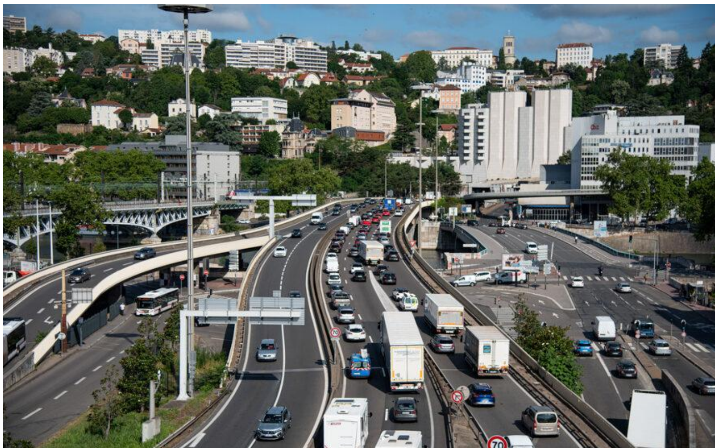
Bouchon à l'entrée du tunnel de Fourvière. Image d'illustration.