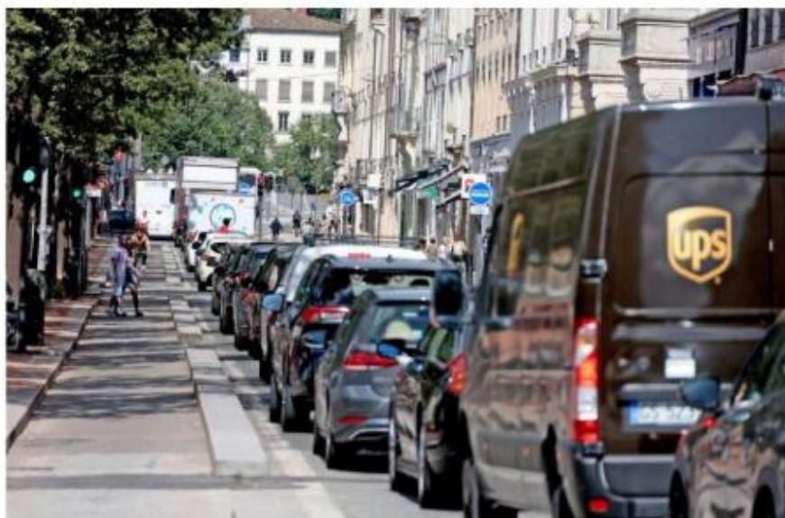
La circulation sur la frange nord de la place Bellecour est constamment paralysée depuis la mise en place de la Zone à trafic limité.

« Notre objectif est de préparer une liste suffisamment exhaustive pour que le nouvel exécutif ait une base de travail », poursuit le responsable, qui convient avoir beaucoup discuté avec les élus de la précédente mandature malgré