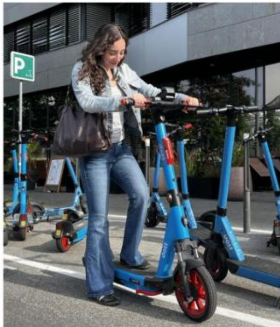
Les nouvelles trottinettes électriques Dott sont équipées de clignotants et d'une batterie améliorée.

Si Dott promet une « capacité de batterie multipliée par deux » ainsi qu'une « stabilité