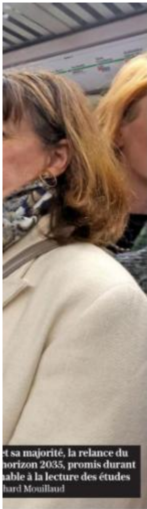
et sa majorité, la relance du horizon 2035, promis durant la lecture des études de l'ouest lyonnais.