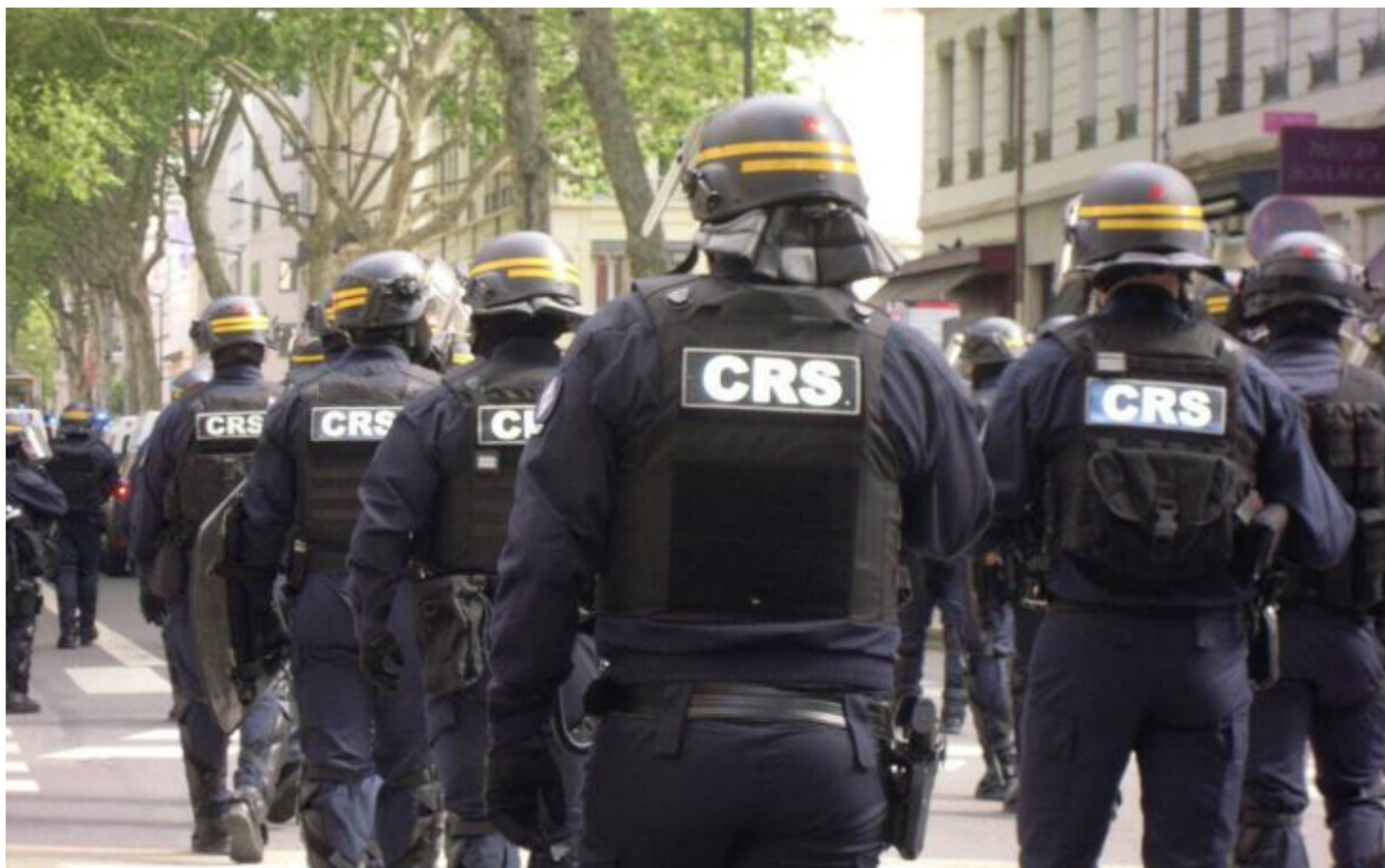
CRS lors de la manifestation du 1er mai 2026 à Lyon (GM)