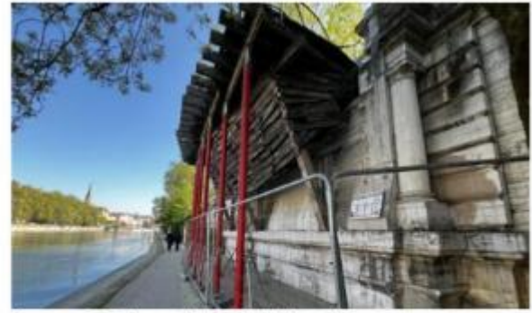
L'œuvre Le Balcon , elle, est très dégradée. Son accès est interdit.