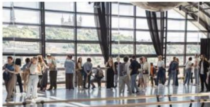
Le studio de ballet de l'Opéra de Lyon avec sa célèbre verrière, au dernier étage, sera ouvert.

Samedi 9 mai, l'Opéra de Lyon ouvrira ses coulisses aux curieux pour son événement « Backstage » 2026. La billetterie ouvre ce mercredi.