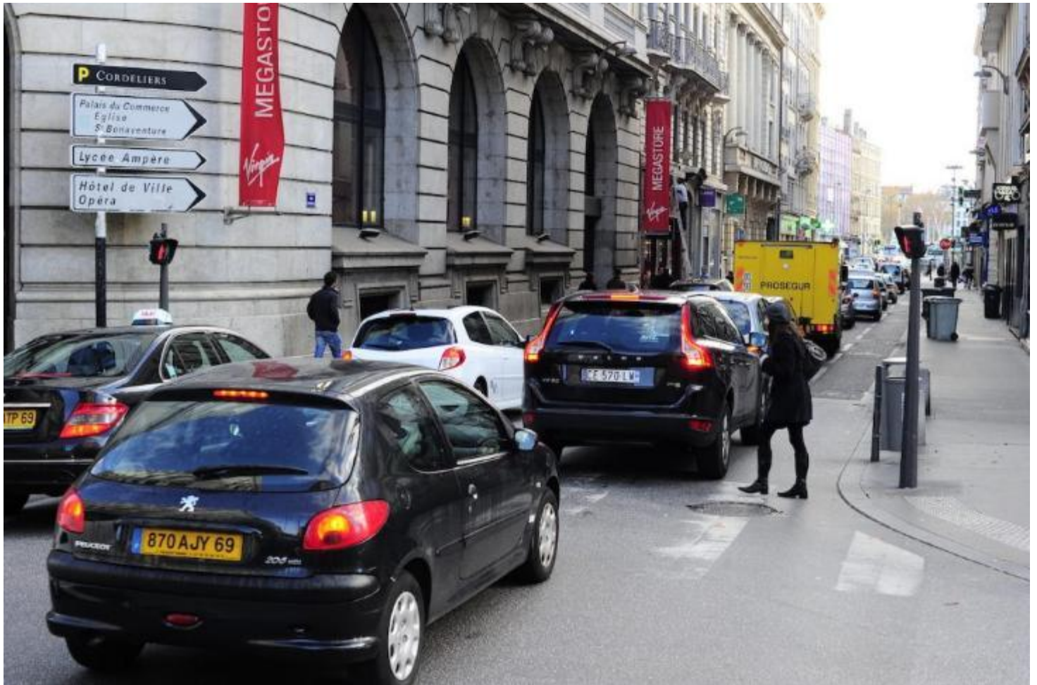
La rue Grenette à l'époque du Virgin Megastore, aux environs de 2012 (photo d'illustration).

Le maire écologiste de Lyon donne la parole aux usagers et riverains de cet axe majeur de la Presqu'île, que ses adversaires politiques de la Métropole veulent rouvrir aux automobiles. Cette concertation s'est faite... sans concertation avec le Grand Lyon.