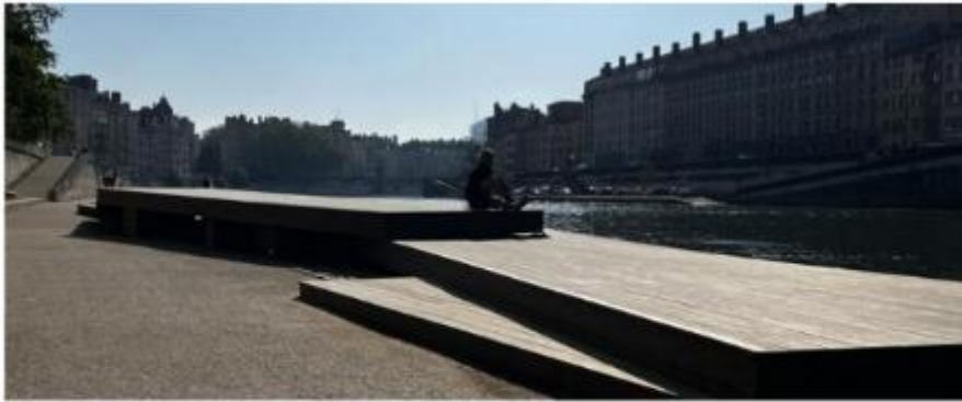
L'œuvre Les Planches , située en face de L'Homme de la Roche a été rénovée.