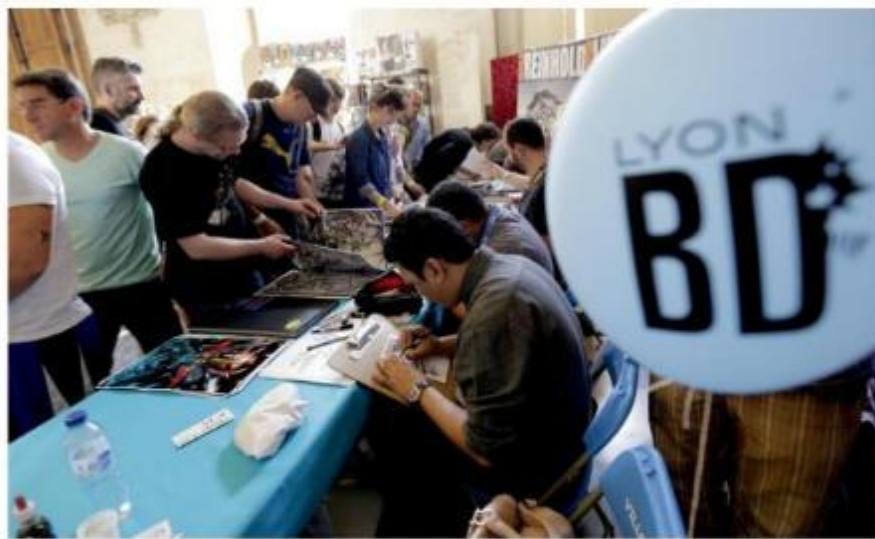
La 21 e édition aura lieu du 12 au 14 juin à Lyon.

C'est la nouveauté majeure de cette édition. Le Prix Lyon BD Jeunesse couronnera pour la première fois, une œuvre choisie par de jeunes Lyonnais. Cinq titres sont en lice : Secret Squelette , Mi-Mouche , L'île de Minuit , Foudroyants et