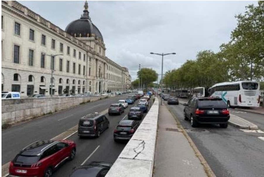
Des bouchons sur les quais du Rhône. Le projet d'aménagement de la rive droite est pour l'instant suspendu par la Métropole.

Cet article est publié dans le magazine « nouveau Lyon » de mai 2026 dans les kiosques depuis le 24 avril 2026 dont actu Lyon est partenaire.