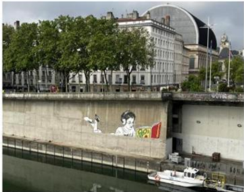
La fresque réalisée par le duo Faile sur les quais du Rhône a été effacée à moitié.

Sauf que presque un an plus tard, une partie de l'œuvre subsiste toujours sur ce mur et n'a pas été effacée. Selon nos informations, vraisemblablement alertés par des riverains attachés à l'œuvre, les services de la Métropole de Lyon auraient demandé à la Ville de Lyon de faire cesser l'opération de détagage.