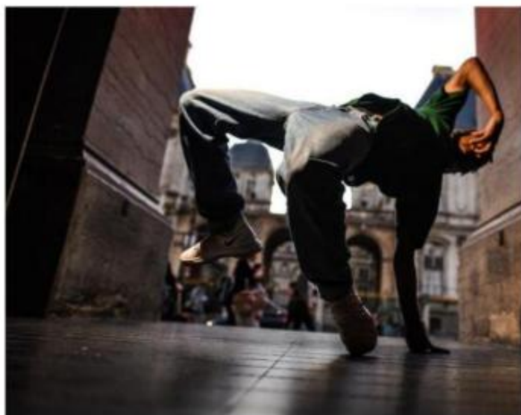
Opéra breaking battle, ou le retour de la danse hip-hop à l'Opéra de Lyon.