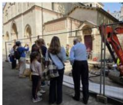
Les squelettes bien visibles ont été découverts ce mardi après des travaux rue de l'Abbaye d'Ainay.