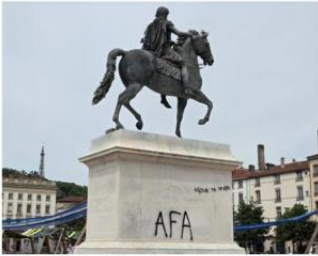
Les inscriptions en noir sur le socle en marbre de la statue, étaient toujours visibles ce samedi.