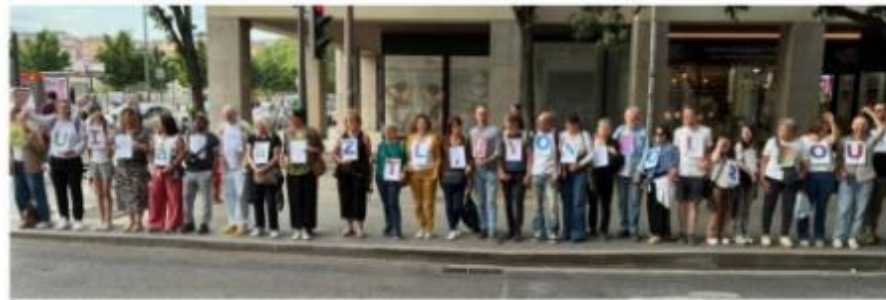
« Oui à la ZTL Lyon pour tous »

Balades et apéros pour trouver un terrain d'entente avec les commerçants et habitants qui contestent la ZTL sont les objectifs du collectif. Ce 30 avril, 50 membres et sympathisants se sont rassemblés au café Grenette, au coin de la rue éponyme et du quai Saint-Antoine.