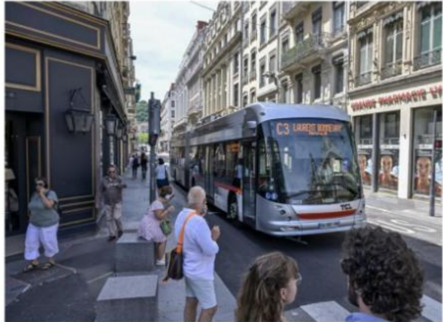
La rue Grenette a été réaménagée en juin 2025.

En tout cas, la réaction n'a pas tardé. C'est aussi par communiqué qu'elle est arrivée. Véronique