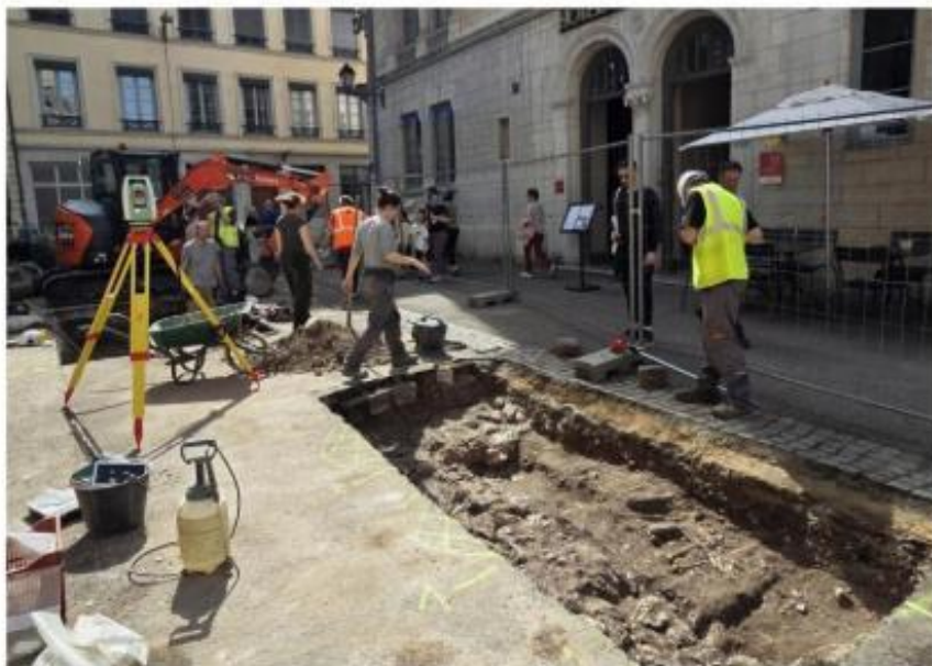
Les archéologues n'ont pas eu à creuser très profond pour mettre à jour ces squelettes.

frayé un chemin parmi les passants, les touristes et les riverains, ces derniers multipliant les interrogations. Le Progrès était sur place. En se penchant un peu, on devine les restes d'un crâne et de nombreux ossements. Tout le monde s'arrête et tout le monde pose des questions tant l'histoire de Lyon intéresse et intrigue. Résultat, beaucoup de curieux se pressent contre les grilles derrière lesquelles les archéologues poursuivent leurs recherches. Juste avant que le site ne soit entièrement clos d'un tissu occultant l'emplacement en question.